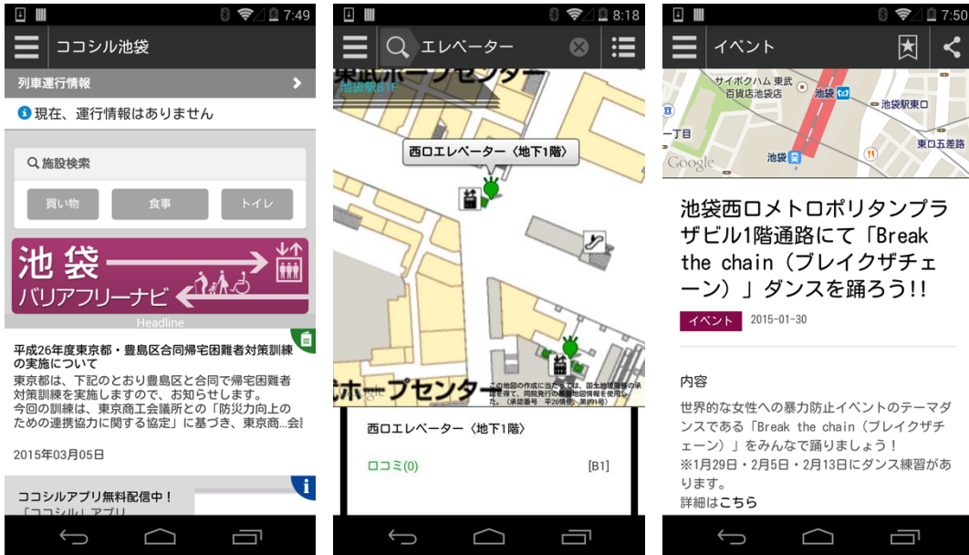
図 1 ココシル池袋

iOS 版 : https://itunes.apple.com/jp/app/kokoshiru-yin-zuo/id558488145?mt=8